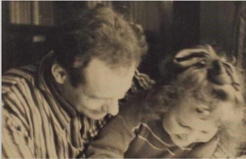
Іван Мележ і яго старэйшая дачка

Дачка Людміла ўспамінала, што Мележ НІКОЛІ не павышаў голасу, не праяўляў дыктатарскіх замашак, не надакучаў павучаннямі і забаронамі.