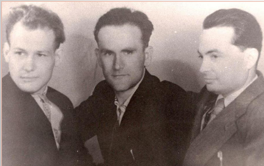
Іван Мележ, Янка Брыль і Усевалад Краўчанка

Янка Брыль настолькі быў захоплены і ўражаны раманам Івана Мележа «Людзі на балоце», што вырашыў кінучь працу ў выдавецтве і стаць вольным літаратарам, каб нішто яму не замінала завяршыць свой раман «Птушкі і гнёзды».