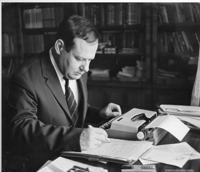
І. П. Мележ

Абодва пісьменніка пачыналі свой творчы лёс с паэзіі. Абодва творцы з'яўляюцца народнымі пісьменнікамі БССР.