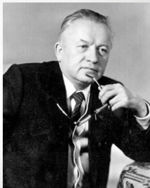
Іван Пятровіч ШАМЯКІН