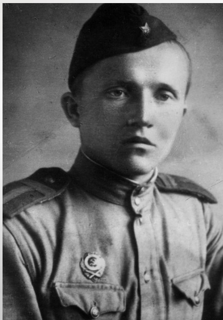
І. П. Шамякін

У час вайны Шамякін і Мележ удзельнічалі ў баявых дзеяннях