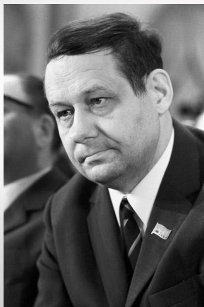
Іван Паўлавіч МЕЛЕЖ